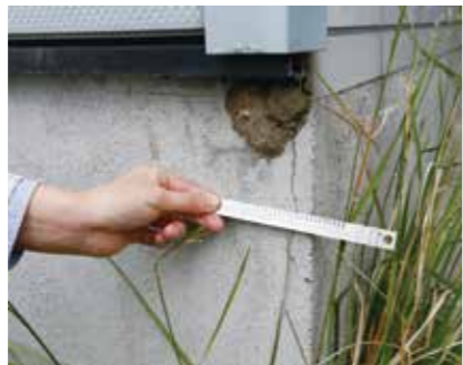
基礎コンクリートひび割れ計測