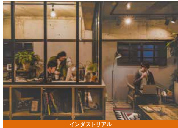
インダストリアル

リノベーション(10万円/㎡)をベースに、インテリアコーディネート(2万円/㎡)やオプション工事を加えることができる